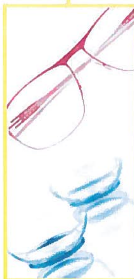
MOKO by OKO

C'est la part des français portant des lunettes ou des lentilles. Sources : GfK Retail and Technology 2011